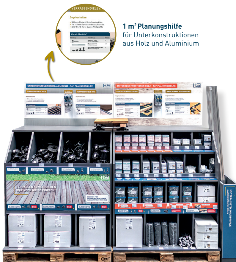
Platzierung in Reihe

Wir gestalten Ihnen auf Anfrage gerne ein individuelles Verkaufsregal mit Produkten für den Terrassenbau, das auf Ihre Kunden abgestimmt ist.