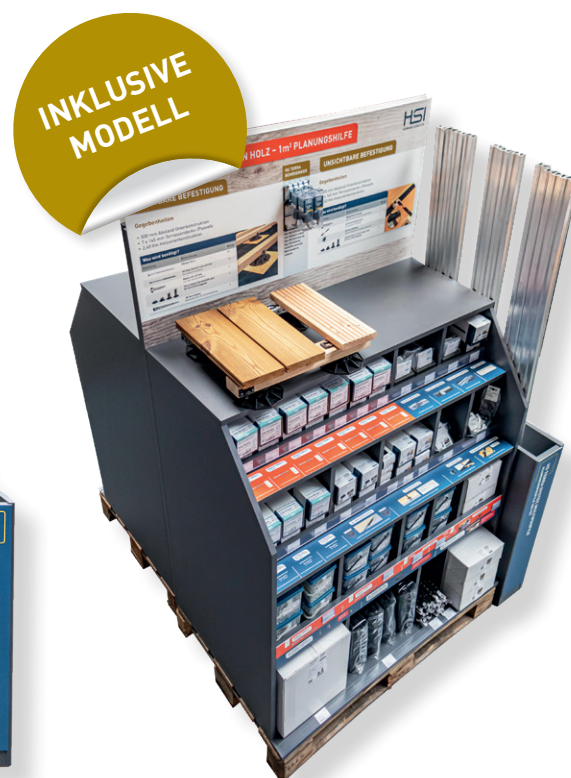
Platzierung als Insel